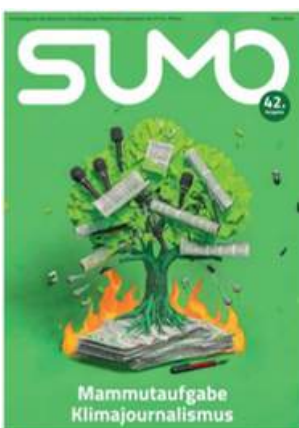
SUMO #42 sumomag