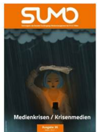
SUMO #36 sumomag