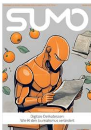
SUMO #41 sumomag