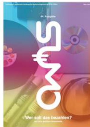
SUMO #44 sumomag