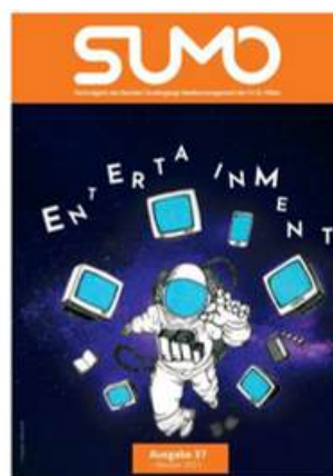
SUMO #37 sumomag