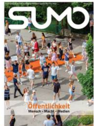
SUMO #43 sumomag