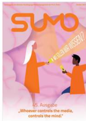
SUMO #45 sumomag